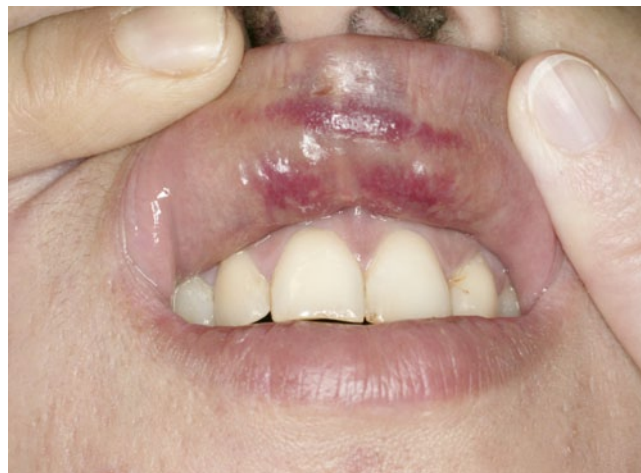
Abb. 5 ► Fotografische Dokumentation einer Unterblutung der Mundvorhofschleimhaut nach Schlag mit der flachen Hand ins Gesicht

Die rechtssichere Dokumentation sollte auch eine Einschätzung einer eventuellen Lebensgefahr ermöglichen. Relevant ist dies insbesondere, wenn eine Gewalteinwirkung gegen den Hals erfolgte. Auch wenn es nicht leicht ist, die Lebensgefahr eines überlebten Angriffs gegen den Hals einzuschätzen, ist dies im Hinblick auf eine strafrechtliche Einordnung der Tat von hoher Bedeutung. Finden sich Stauungsblutungen (Petechien) in den Lid- und Bindehäuten, der Mundschleimhaut oder der Hinterohrregion, ist von einer relevanten Verminderung des Blutabflusses auszugehen. Diese ist mit massiver Blutstauung und somit Unterversorgung des Gehirns mit Sauerstoff vergesellschaftet, sodass von einer lebensgefährlichen Situation ausgegangen werden kann. Zu dokumentieren sind ferner anamnestische