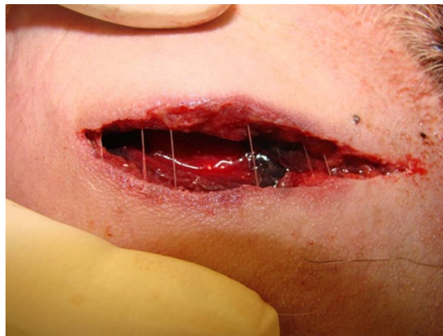
Abb. 4 ► Fotografische Dokumentation einer Quetsch-Riss-Wunde an der Stirn infolge eines Sturzes bei häuslicher Auseinandersetzung